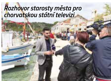
Rozhovor starosty města pro chorvatskou státní televizi

V první polovině května navštívila delegace z meziříčské radnice partnerské město Tisno v Chorvatsku. Představitelé obou měst se po dvouleté covidové pauze utvrdili v pokračujícím partnerství a dohodli soustředění velkomeziříčských volejbalistů, kteří tam odjedou na konci srpna. Další setkání s vedením chorvatského Tisna se připravuje na podzim v našem městě.