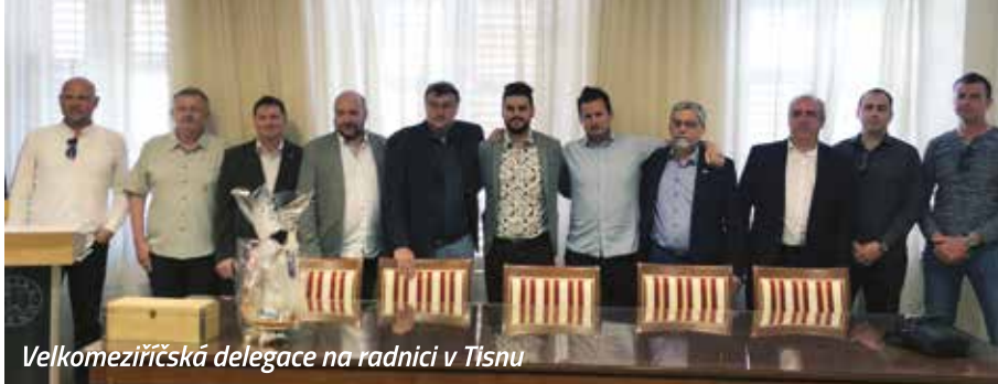
Velkomeziříčská delegace na radnici v Tisnu