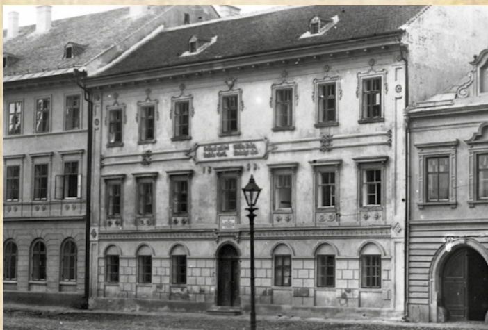
Obecná škola na náměstí byla v polovině 19. století zvýšena o druhé patro

Text: Marie Ripperová