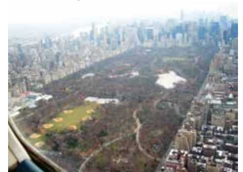
Pohled na Central Park, který se rozkládá na ostrově Manhattan

Ve stejném domě zemřel o deset let později slavný hudební skladatel a dirigent Leonard Bernstein, který se proslavil např. muzikálem West Side Story. Josef Švec navštívil i další místa v USA, datum jeho příštího vyprávění doprovázeného fotografiemi včas oznámíme.