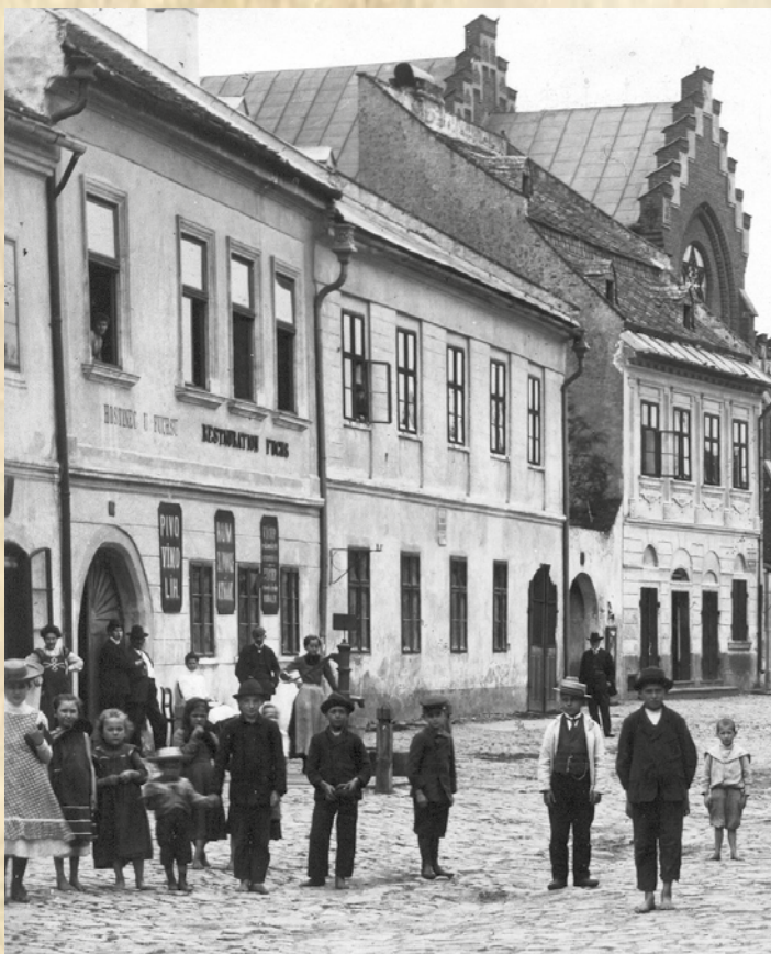
V prostředním domě byla v 19. století umístěna německá škola,

přestože roku 1780 byla přistavěna druhá třída. Budova byla ve špatném stavu, takže i krajský úřad, který v letech 1783-1794 sídlil v Meziříčí, město opakovaně vyzýval ke zjednání nápravy. Pokud chtěli rodiče zajistit svým potomkům vzdělání, posílali je do školy v Oslavici, kde je vyučoval vysloužilý poddůstojník. Teprve roku 1801 byla na náměstí vystavěna nová škola čp. 14 (dnes MÚ, dříve spořitelna). Byla patrová, v přízemí byly dvě třídy a v patře dva byty pro učitele. V přístavku ve dvoře měla být další třída, ale zpočátku sloužil jako obydlí podučitelů. V židovském městě byla vyšší náboženská škola ješiva, kde se vzdělávali zase jen chlapci. Po zavedení povinné školní docházky byla i zde zřízena škola. Vyučovací jazyk byl německý. Každý Žid, který se chtěl oženit, musel prokázat znalost němčiny. Škola byla umístěna v přízemí rabínského domu, dnes je to součást restaurace U Wachtlů (je to dům nejbliže k synagoze).