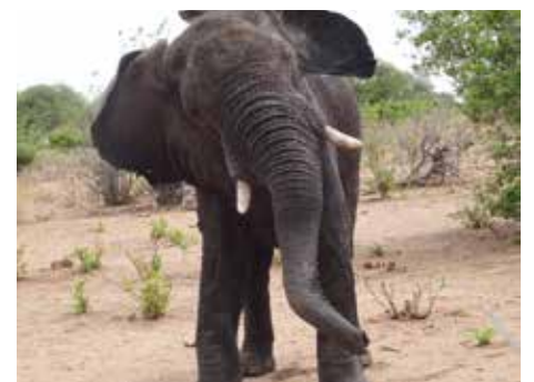
Slon v přírodní rezervaci Chobe

Afriky si můžete přijít poslechnout v úterý 17. března v 16 hodin do Jupiter klubu.