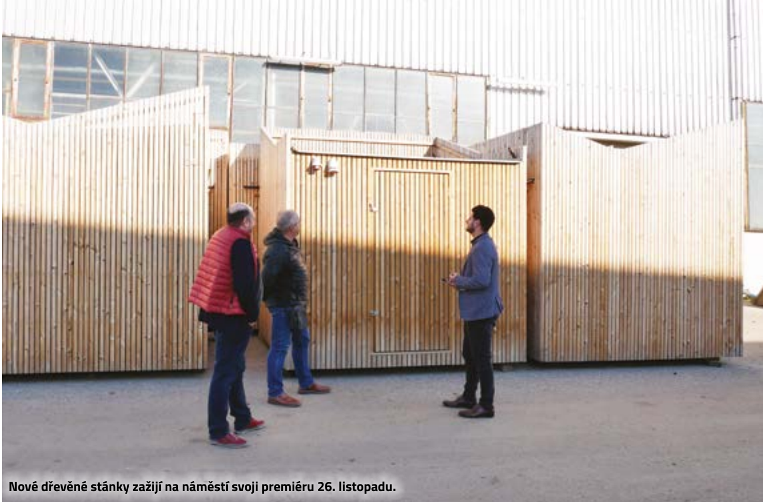
Nové dřevěné stánky zažijí na náměstí svoji premiéru 26. listopadu.