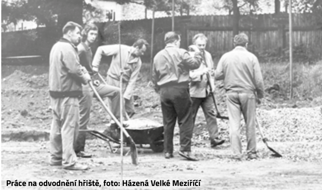
Práce na odvodnění hřiště