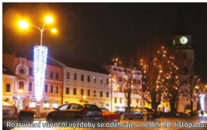
Rozsvícení vánoční výzdoby se odehraje v neděli 28. listopadu.

Neváhejte přijít na náměstí a nasát vánoční atmosféru. Společně oživíme centrum.