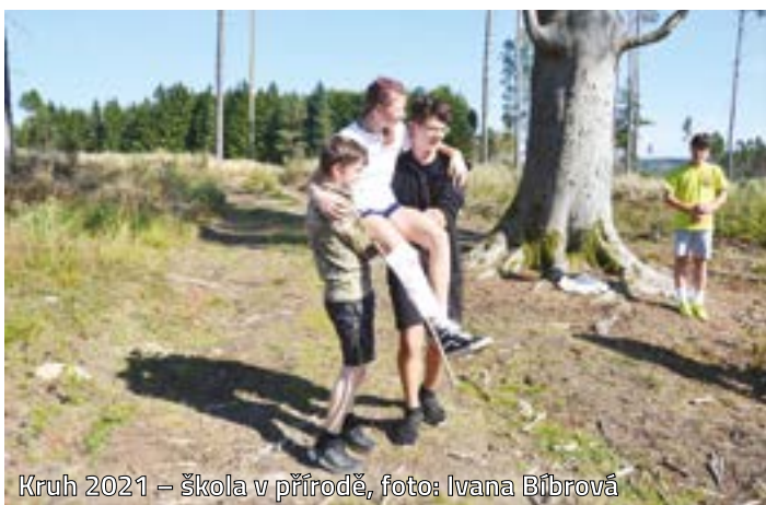
Kruh 2021 – škola v přírodě

Stalo se již tradicí na ZŠ Sokolovská, že třetí týden v září utichnou třídy 8. ročníku kvůli čtyřdenní „škole“ v přírodě – Kruhu 2021. A tak už po patnácté odjeli žáci a žákyně do rekreačního střediska u Záseky, aby zde soutěžili v různých znalostních, sportovních a praktických disciplínách a hlavně si užili pobytu na čerstvém vzduchu.