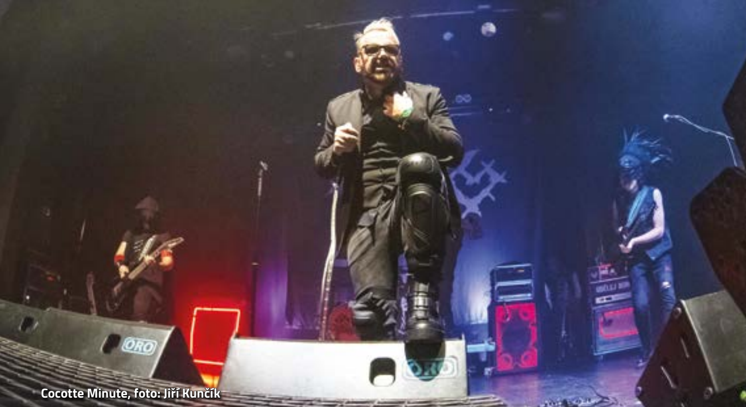
Cocotte Minute