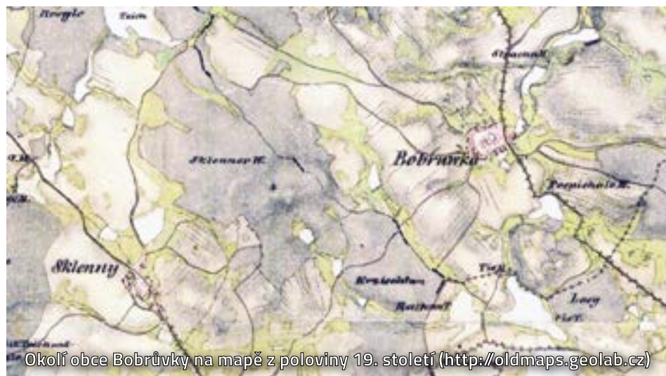
Okolí obce Bobruvky na mapě z poloviny 19. století ( http://oldmaps.geolab.cz )