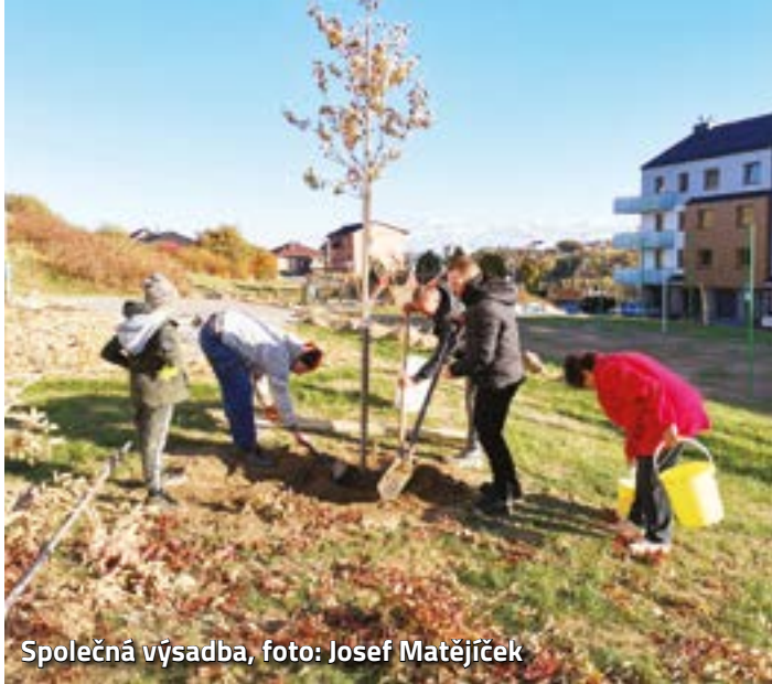
Společná výsadba