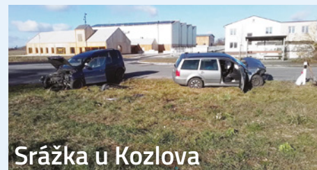
Srážka u Kozlova

V úterý 7. listopadu 2023 před dvanáctou hodinou zasahovala jednotka profesionálních hasičů ze stanice ve Velkém Meziříčí u dopravní nehody nákladního automobilu na 146. km dálnice D1 ve směru na Brno. Hasiči poskytli zraněnému řidiči předlékařskou pomoc. Následně ve spolupráci se zdravotníky zraněného transportovali do vrtulníku, provedli protipožární opatření a místo události technicky zabezpečili.