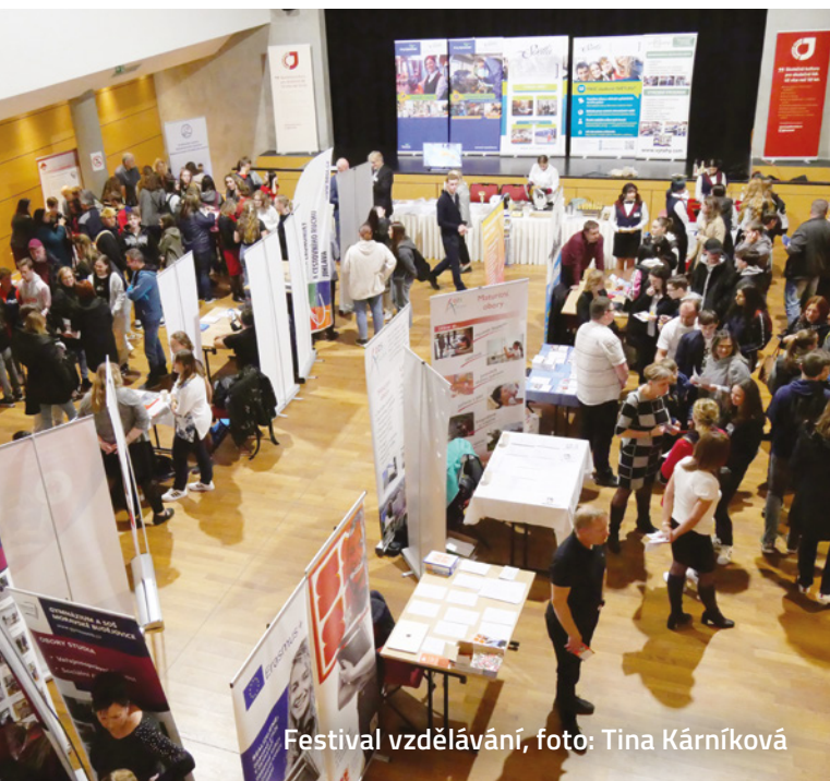
Festival vzdělávání