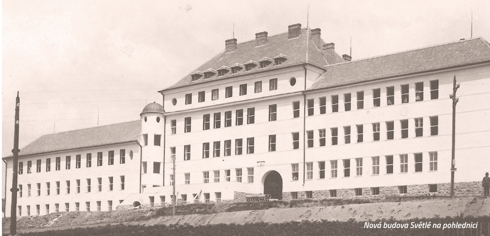
Nová budova Světlé na pohlednici