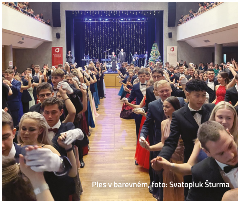
Ples v barevném, foto: Svatopluk Šturma