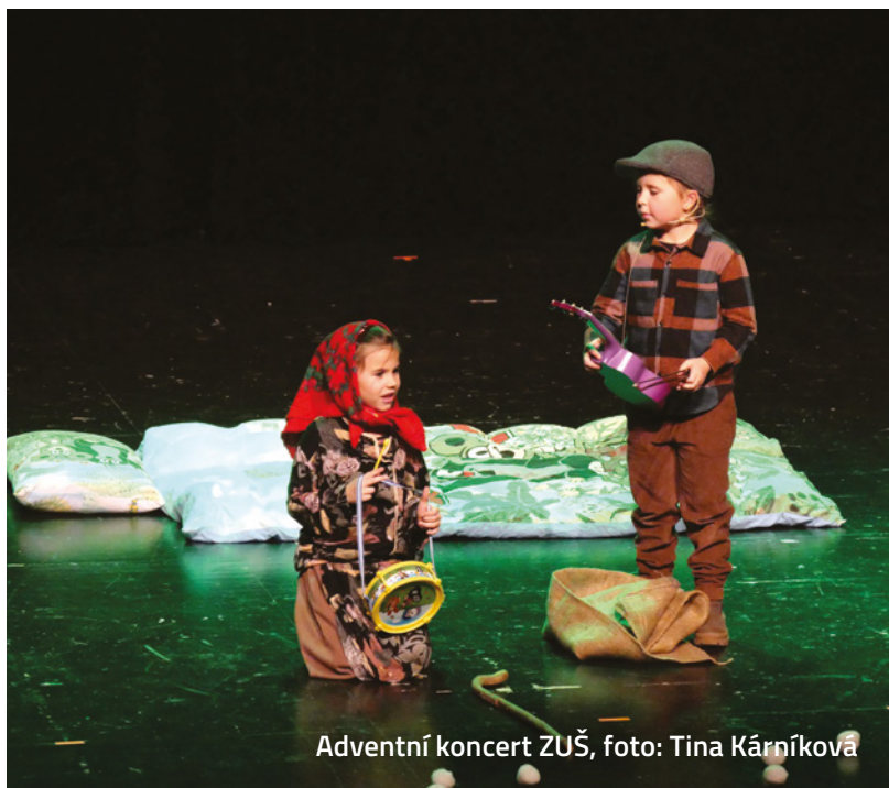
Adventní koncert ZUŠ, foto: Tina Kárníková