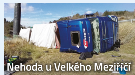
Nehoda u Velkého Meziříčí

V úterý 7. listopadu 2023 před dvanáctou hodinou zasahovala jednotka profesionálních hasičů ze stanice ve Velkém Meziříčí u dopravní nehody nákladního automobilu na 146. km dálnice D1 ve směru na Brno. Hasiči poskytli zraněnému řidiči předlékařskou pomoc. Následně ve spolupráci se zdravotníky zraněného transportovali do vrtulníku, provedli protipožární opatření a místo události technicky zabezpečili.