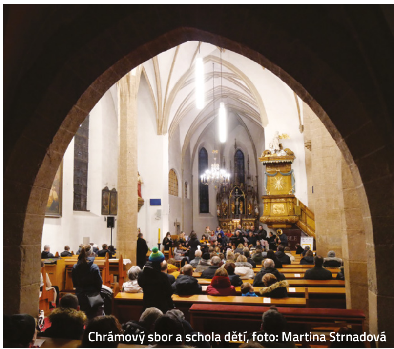
Chránový sbor a schola dětí