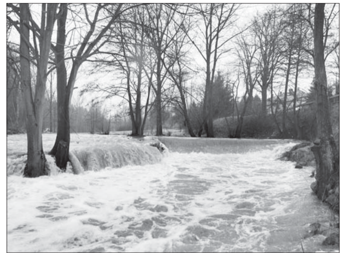
U koupaliště se Balinka vylila na louku, na Paloukách zatopila cestu a v Jelinkově vile čerpala vodu ze sklepu.

pochválil starosta a dodal, „jinak ve městě tentokrát nedošlo k žádným problémům, jen Jelinkova vila tradičně čerpala vodu ze sklepa a na Paloukách byla zaplavená cesta, což bývá také snad každoročně.“ Situace tak vyděsila spíš obyvatele Mostišť, protože přehrada začala upouštět větší množství vody. Mezi lidmi se objevily diskuze, že kdyby si vodoohospodáři předpustili víc, nemuseli by teď upouštět tolik. Vedoucí útvaru vodoohospodářského dispečinku Povodí Moravy Marek Viskot vysvětlil: „My musíme mít na paměti i další věc, totiž aby chom byli schopni Mostišť na letní měsíce zase naplnit, protože slouží jako vodárenská nádrž. Měli jsme předpustit na tři metry pod maximální vodní hladinou. Ve čtvrtek a v pátek došlo k výrazným úhrnům srážek, zvýšil se průtok, proto jsme postupně zvyšovali neškodný odtok a podařilo se nám odvést povodeň.“ Nejvyšší odtok z vodního díla