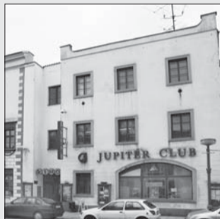
Sídlo Jupiter klubu