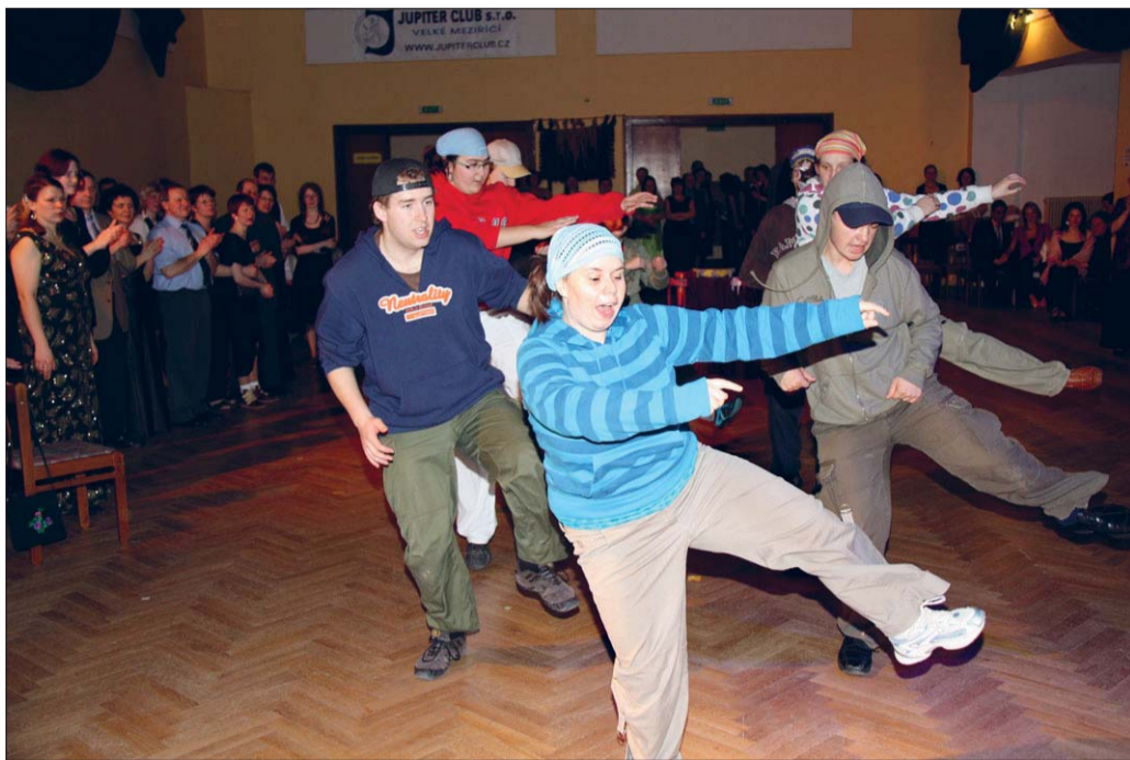
Đeti z DS Březejc předvedly taneční vystoupení ve stylu hip hop.