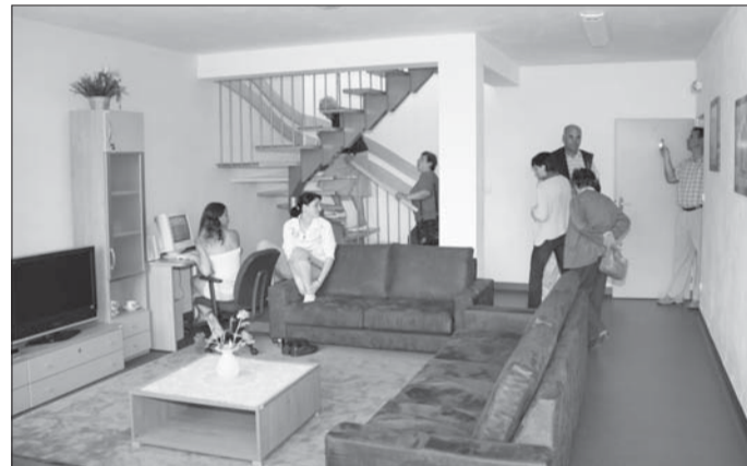
Hosté si prohlédli moderně zařízené prostory výchovného ústavu.