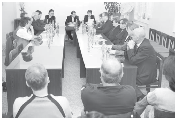
Ustavující zasedání zastupitelstva v Měříně se konalo 10. 11. 2010.