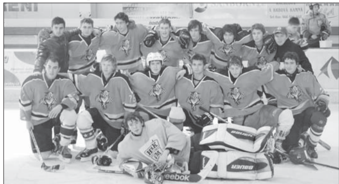
Na snímku tým staršího dorostu.