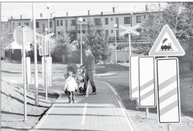
Na dopravním hřišti je i železniční přejezd.

Po dětském dopravním hřišti v Čechových sadech ve Velkém Meziříčí se již mohou prohánět děti. Zatím tedy na vlastních dopravních prostředcích. Sklad s koly a tříkolkami pro dopravní výuku dětí z mateřských i prvňošků postupně získává škola na hřišti zatím ještě není. Ale například světelná signalizace je již v provozu – semaforey svítí a nechybí dopravní značky svislé a vodorovné, dokonce ani železniční přejezd.