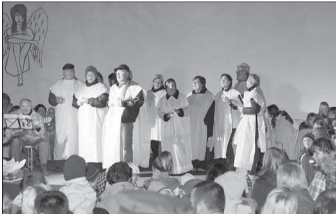
Pohodáři s písněmi ke svatomartinské slavnosti.