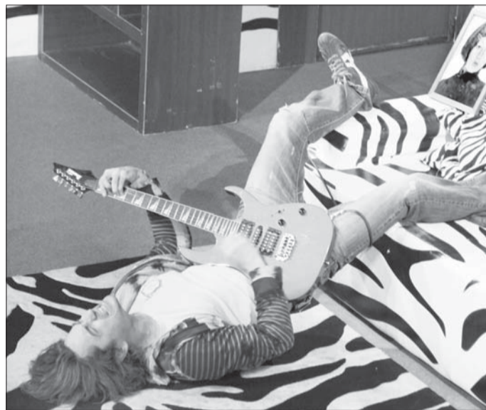
Saša Rašilov jako krásný kytarista Robert. Zcela vpravo na fotce v rámečku Vanda Hybnerová.

Představením Miláček Anna, které uvedlo Divadlo Palace, skončila v Jupiter klubu podzimní divadelní sezona. V ní si diváci přišli na své, nabídka byla rozmanitá. Nechyběly různé žánry a právě závěr sezony patřil světové komedii Miláček Anna od Marca Camolettiho. V ní se představily dva skutečné manželské páry – Vanda Hybnerová a Saša Rašilov a Linda Rybová s Davidem Prachařem. Na pódiu se z nich ale stali milenci. Manželé Bernard (D. Prachař) a Jacqueline (V. Hybnerová) měli původně strávit víkend společně u matky. Jenomže Bernard chtěl být raději se svojí milenkou Brigitte (L. Rybová), a tak si vymyslel služební cestu.