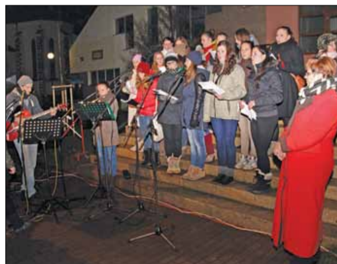
V Křižanově zazpíval během první adventní neděle soubor i děti z mateřské školy.