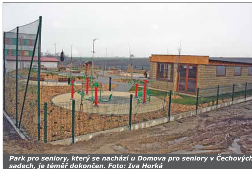
Park pro seniory, který se nachází u Domova pro seniory v Čechových sadech, je téměř dokončen.