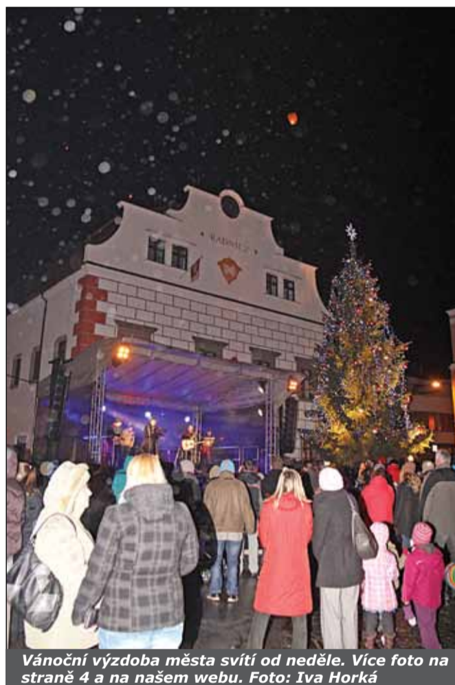
Vánoční výzdoba města svítí od neděle. Více foto na straně 4 a na našem webu.

Tradiční vánoční strom rozsvítili Velkomeziříčtí o první adventní neděli 30. listopadu na náměstí, stejně tak začala zářit i ostatní světelná výzdoba ve městě.