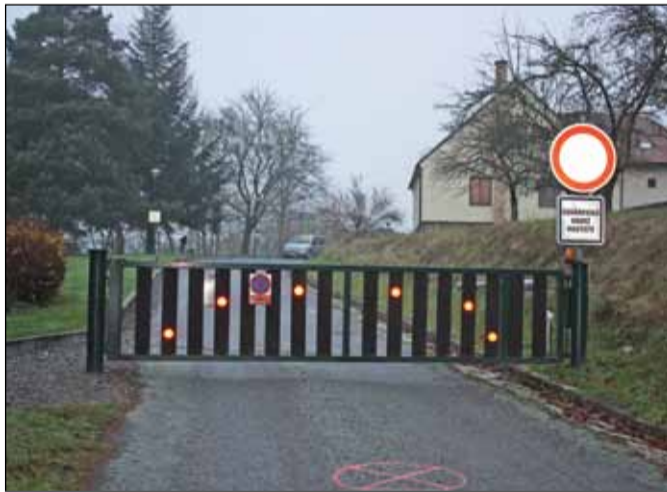
Vjezd na hráz je autům již nyní zamezen závorou od Vídně. Snímek je z 30. 11. 2014.

„V případě havarijní situace lze řešit uzavření hráze přenosným zařízením,“ vyslovila se obec. Ani další účastník řízení ze sousedství přehrady se záměrem Povodí nesouhlasí a poukazuje například na to, že zhruba pětadvacet let nebyla silnice přes hráz uzavřena a vždy byla v souladu se statutem veřejně přístupné účelové komunikace přístupná a ani nebyl dán důvod k jejímu uzavření.