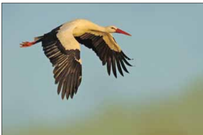
Snímek čápa v letu fotil autor Nikonem.

Podzim a Vánoce spolu zdánlivě nesouvisí, ale v jednom nepochybně ano. Podzimní výlovy rybníků jsou tradičním vyvrcholením rybářské práce, ale i nezbytnou nutností kvůli kaprům, bez nichž si české rodiny neumějí představit vánoční stůl. A právě vůně bahna, grogu či svařeného vína, rybářské sítě plné ryb a praktické ukázky rybářského řemesla dělají z výlovů vděčný divácký zážitek. Zažít atmosféru výlovu Velkého netínského rybníka na vlastní kůži si ani letos ne-