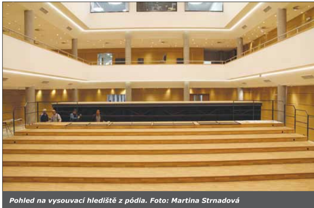
Pohled na vysouvací hlediště z pódia.

Stavba víceúčelového sálu Jupiter klubu ve Velkém Meziříčí se blíží ke kolaudaci. Ta by měla proběhnout v polovině prosince.