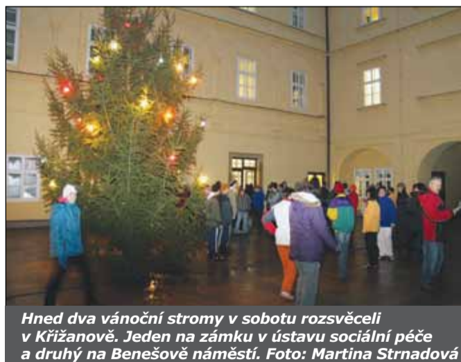
Hned dva vánoční stromy v sobotu rozsvětili v Křižanově. Jeden na zámku v ústavu sociální péče a druhý na Benešově náměstí.