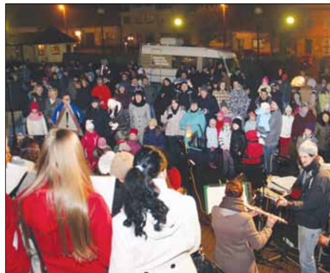
Rozsvícení vánočního stromu si tamní obyvatelé nenechali ujít. Více foto na webu.