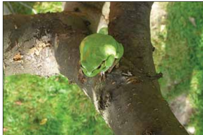
Rosnička zelená od netínského rybníka.

Velký netínský rybník patří do soustavy netínských rybníků, která zahrnuje ještě rybníky Křenčák, Vrkoč, Závist, Prchal, Kněžský, Ústecký rybník a další menší rybníky. Jejich zakládání doporučoval již král Karel IV. ve 14. století. Na konci 19. století se rybníky staly majetkem šlechtické rodiny Podstatzky-Lichtenstein. Rozloha Velkého netínského je 41, 6 ha, šířka hráze 20 metrů, výška 10 a délka 200 metrů a roste v něm především rdesno obojživelné a žabník jitrocelový. Zástupci