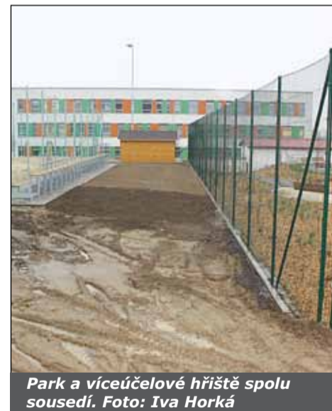
Park a víceúčelové hřiště spolu sousedí.