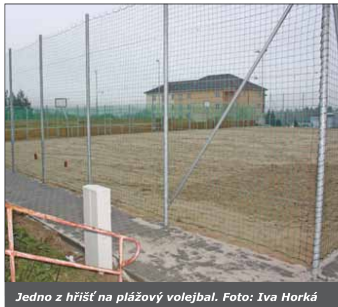
Jedno z hřišť na plážový volejbal.