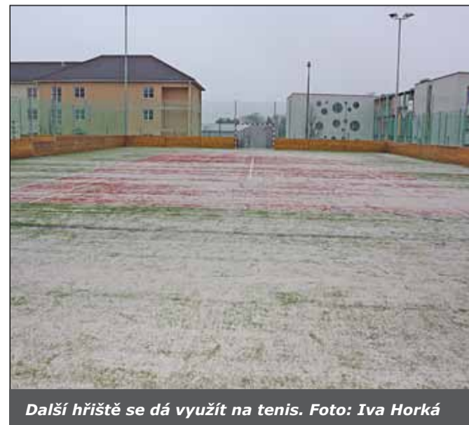
Další hřiště se dá využít na tenis.