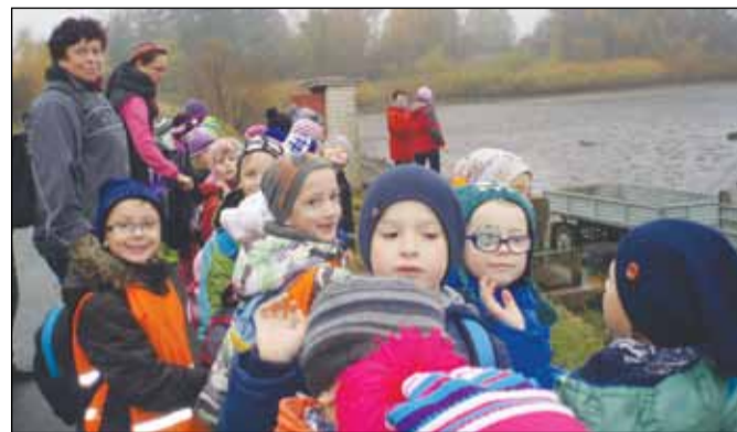
řovi z Rybářství Kolář ve Velkém Meziříčí i zaměstnancům, kteří se o nás tak pěkně postarali.

vyprávěl zajímavé věci o rybách. Také nás navštívila rybářka, která nám donesla moc dobrou sladkou svačinku. Po ní jsme si mohli zblízka prohlédnout různé druhy ryb a toho největšího tolstolobika jsme si i pohladili. Na rozloučenou jsme dostali „rybí pexeso“. Zpět do školky se nám vůbec nechtělo. Ale co naplat, naposledy jsme se rozhledli po okolní přírodě, zamávali a plní dojmu a zážitků odjžděli. A víte, co jsme měli dobrého k obědu ve školce? No přece rybí polévku. Mňam! I nám pedagogům se výlet moc líbil. Tímto děkujeme panu Kolá-