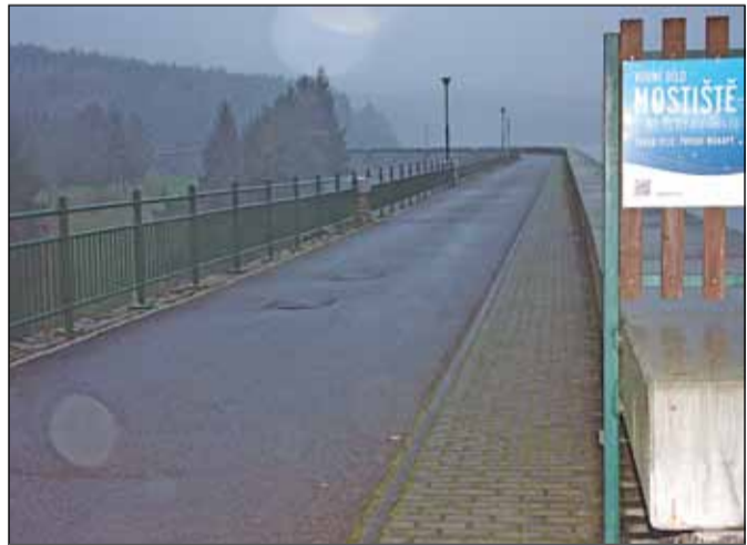
Povodí Moravy chce na koruně hráze osadit brány. To se mnohým nelíbí, ani obci Vídeň.